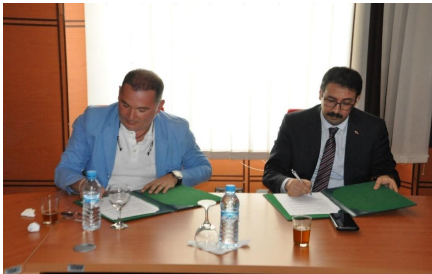
Cérémonie de signature de la convention entre le CHUIR et la SMMR-MF

Dans le cadre du partenariat public-privé, une convention de partenariat, relative au développement des activités de procréation médicalement assistée (PMA) entre le Centre Hospitalier Universitaire Ibn Rochd (CHUIR) et la Société Marocaine de Médecine de la Reproduction et de Médecine Fœtale (SMMR-MF) a été signée le 15 juillet 2019, au siège de la direction du CHUIR. La convention stipule que les centres opérant dans le secteur privé contribuent aux côtés du secteur public à la formation des professionnels de santé dans le domaine de la procréation médicalement assistée (PMA).